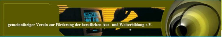
gemeinnütziger Verein zur Förderung der beruflichen Aus- und Weiterbildung e.V.